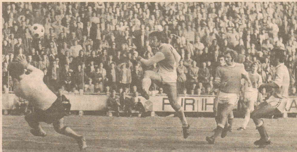
Wenn der stämmige Bähringer vom FCK in Nähe des gegnerischen Strafraumes zum Schuß kommt, dann droht Gefahr! Beim 2 : 1 gegen den FC Rot-Weiß Erfurt (links Benkert) nahm er mehrmals entschlossen Maß.