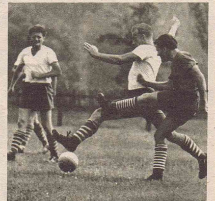
Im Rahmen des III. Turn- und Sportfestes fand auch ein Fußballturnier der Bezirksklassenmannschaften statt. Unser Foto zeigt eine Szene aus dem Endspiel, das Lok Ost Leipzig gegen Einheit Ludwigslust mit 4 : 0 für sich entschied.

Das weiß Heinz Labs beispielsweise auch von Detlef Hartmann, der 1959 in Leipzig zur Kreiswahl von Prenzlauer Berg gehörte, heute Übungslei-