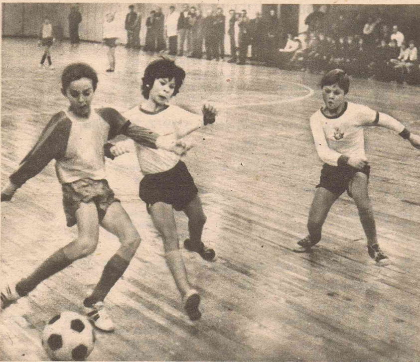
Winterzeit - Hallenzeit. Mit ausnahmslos großer Begeisterung spielt in diesen Wochen und Monaten insbesondere der Nachwuchs an dem Hallenparkett. Dieser Schnappschuß stammt aus der Knaben-Begegnung FC Hansa Rostock-FC Vorwärts Frankfurt (Oder) (3 : 3) beim 12. Hallenturnier des Rostocker Klubs.